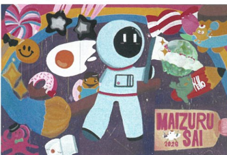
美術部によるパネル装飾

書道部による書道パフォーマンスは、カラフルな塗料を用いたり蛍光塗料をブラックライトで照らすなど工夫を凝らした演目となりました。音楽部は、総勢60人。ステージが狭く感じます。演奏も大迫力でした!