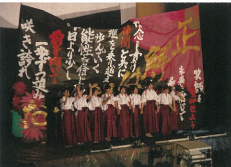
書道部による書道パフォーマンス

ダンスや演劇だけでなく、課題研究の発表も行われました。これまでの研究成果をプロジェクター等を用いながら分かりやすくプレゼンテーションを行いました。