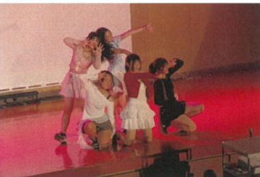
ダンス部によるパフォーマンス